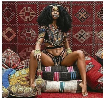
POR RACHEL SABINO*

A moda tem dado passos — por vezes lentos, mas significativos — quando se trata de representatividade de nos holofotes e passarelas. Prova disso é a recente confirmação do estilista Virgil Abloh, dono da marca Off-White, à frente da linha masculina da Louis Vuitton. Ele não está em foco apenas por trazer um estilo contemporâneo de streetwear a uma maison centenária, mas por ser, com mérito, o primeiro negro a ocupar o cargo de diretor criativo na marca.