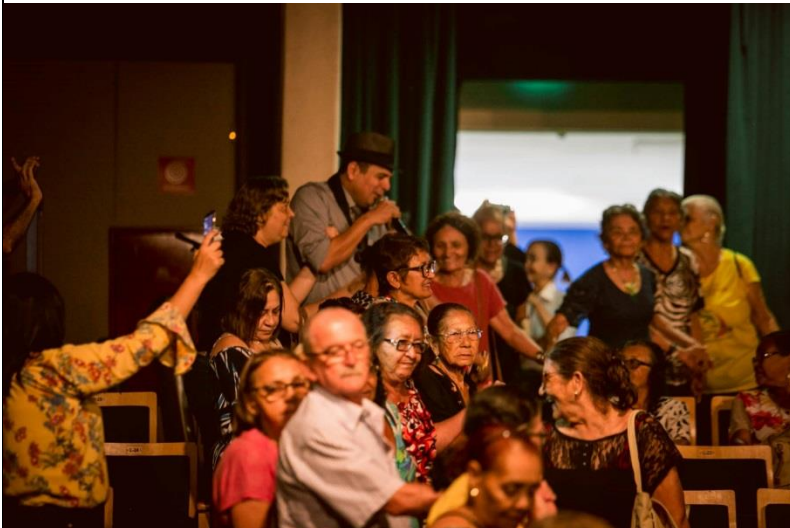
Lançamento do CD e DVD de Dona Gracinha da Sanfona