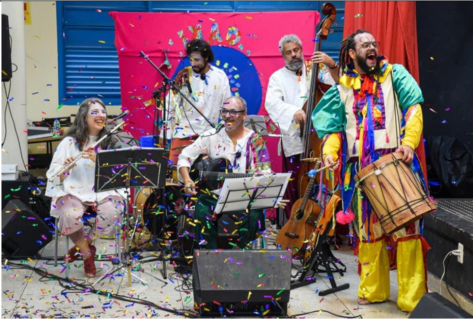
Doação de alimentos para a creche Tia Ilda no Varjão